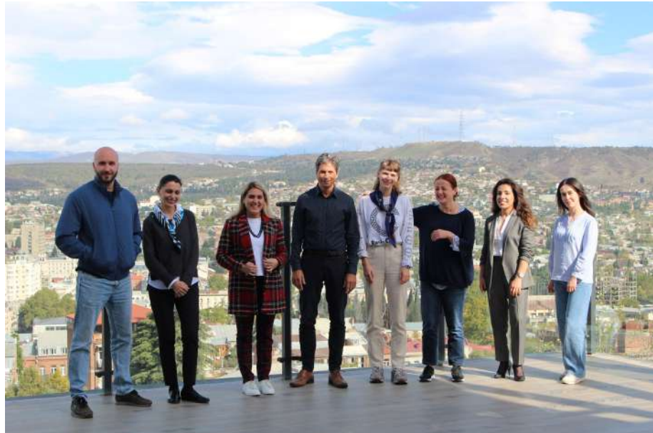
DAAD - საქართველოს სამუშაო გუნდი