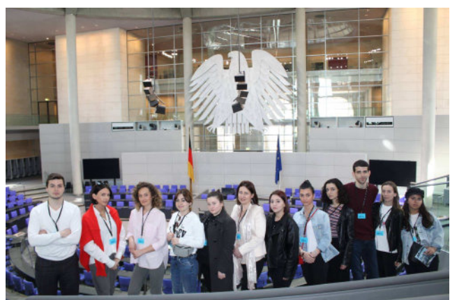
სტუდენტების ჯგუფი გერმანიის ბუნდესტაგში